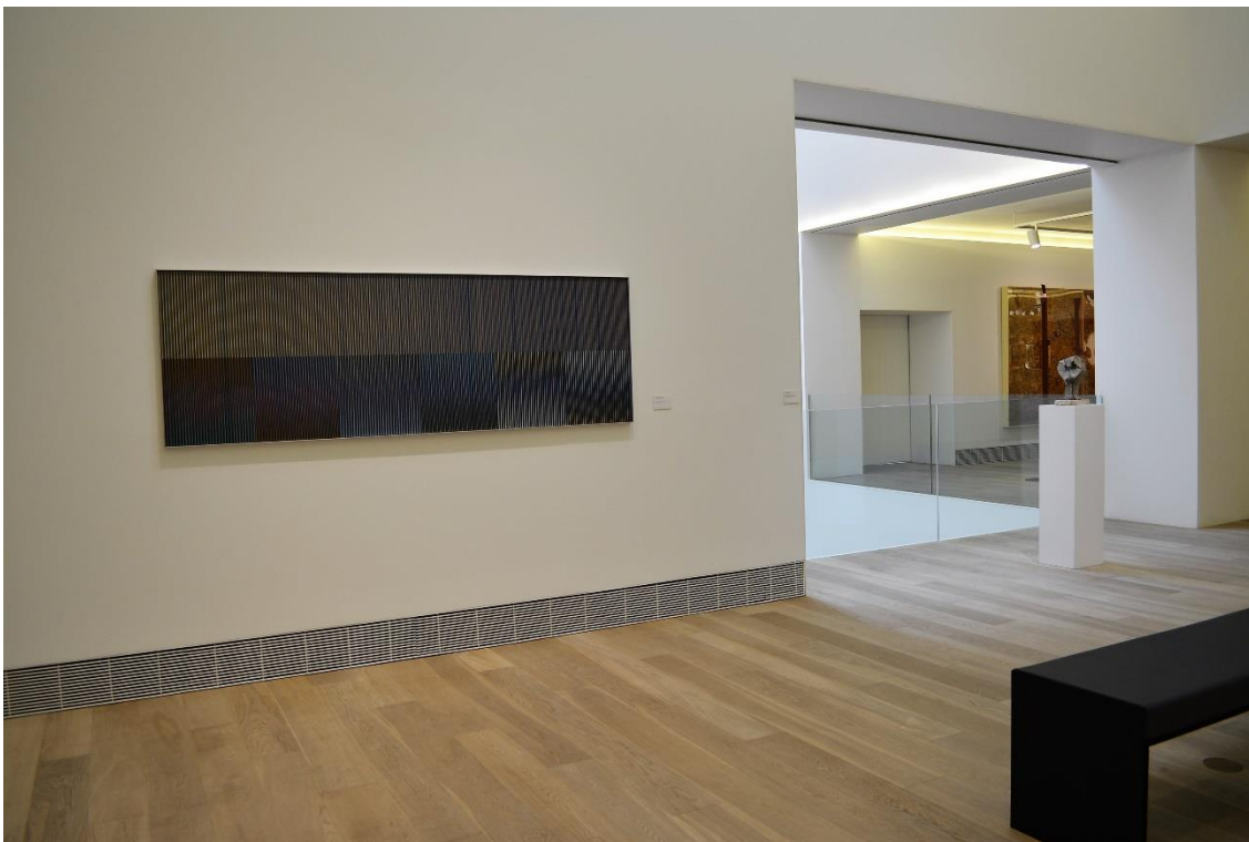
Fisocromía nº 986 , Carlos Cruz – Díez, 1979, en la sala 26 del Edificio de Ampliación del Museo de Bellas Artes de Asturias.