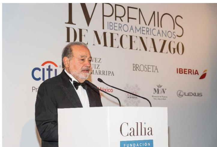
Carlos Slim recogiendo el Premio al Mecenazgo Latinoamericano 2018.