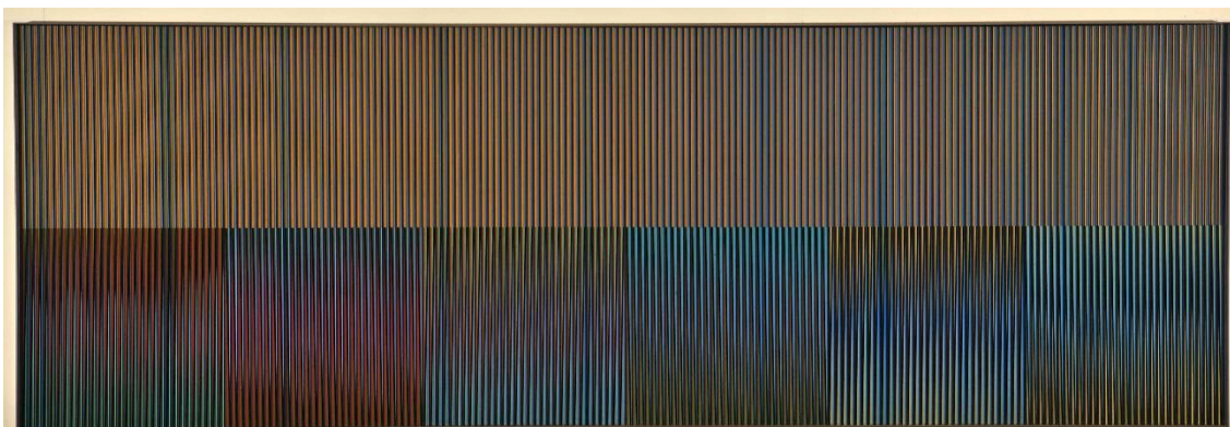
Fisocromía nº 986 , Carlos Cruz – Díez, 1979.

Una vez la coleccionista decidió que quería ejercer la labor del mecenazgo y compartir su obra, para así colaborar con el objetivo de la Fundación Callia de la rehumanización de la sociedad a través del arte. El Museo Bellas Artes de Asturias inauguró en 2015 la Ampliación del Museo de Bellas Artes de Asturias, un nuevo edificio que alberga arte contemporáneo. Con motivo de esta nueva sala del museo y, además, con la ausencia de material latinoamericano, tras varias entrevistas con el director, Alfonso Palacio, la Fundación Callia propuso el Museo como el lugar idóneo para la exposición de la obra.