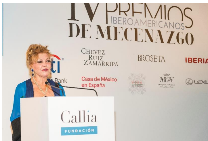
Carmen Cervera, Baronesa Thyssen, recogiendo el Premio al Mecenazgo Español 2018.