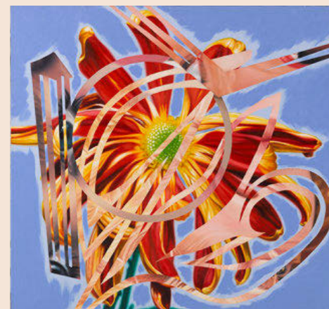
James Rosenquist. 'China Bugle' (1988). Oleo sobre lienzo. Callia asesoró en su compra.

—Además, en Fundación Callia asesoran a coleccionistas que quieren convertirse en mecenas.