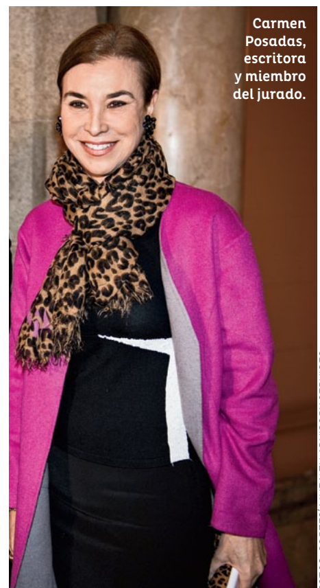
Carmen Posadas, escritora y miembro del jurado.